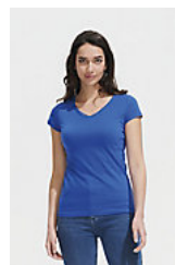
SOL'S MOON 11388