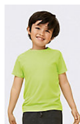
SOL'S SPORTY KIDS 01166