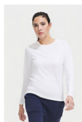
SOL'S SPORTY LSL WOMEN 02072