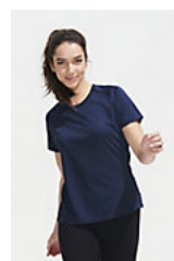
SOL'S SPORTY WOMEN 01159