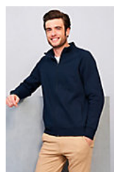
SOL'S SUNDAE 47200