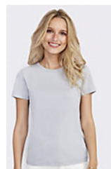
SOL'S REGENT WOMEN 01825