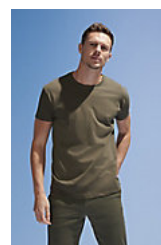
SOL'S REGENT 11380