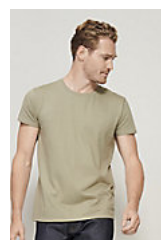
SOL'S PIONEER MEN 03565