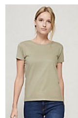
SOL'S PIONEER WOMEN 03579