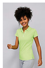
SOL'S PERFORMER WOMEN 01179