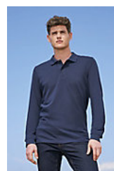
SOL'S PERFECT LSL MEN 02087