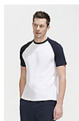
SOL'S FUNKY 11190