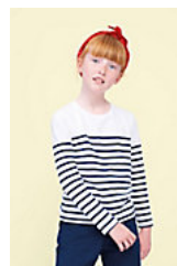
SOL'S MATELOT LSL KIDS 03101