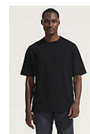
SOL'S BOXY MEN 03806