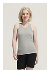
SOL'S JUSTIN WOMEN 01826