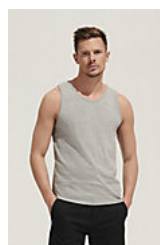
SOL'S JUSTIN 11465