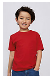
SOL'S Imperial KIDS 11770