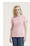
SOL'S Imperial WOMEN 11502