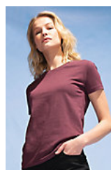
SOL'S Imperial FIT WOMEN 02080