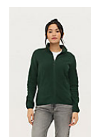
SOL'S FACTOR WOMEN 03824