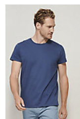
SOL'S CRUSADER MEN 03582