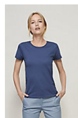
SOL'S CRUSADER WOMEN 03581