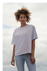
SOL'S BOXY WOMEN 03807